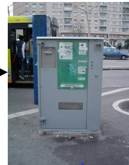
Automates récupérateurs- échangeurs de seringues