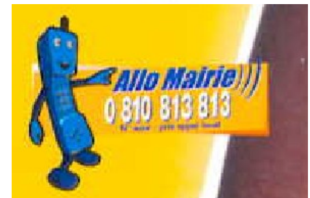
Ramassage seringues sur la voie publique